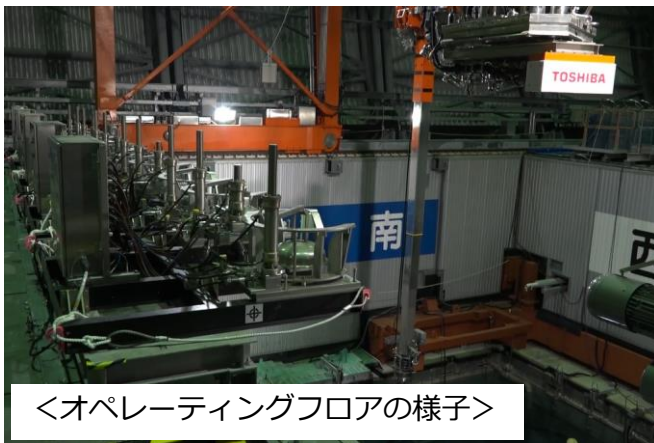
<オペレーティングフロアの様子>