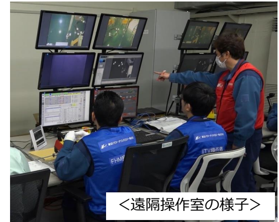
<遠隔操作室の様子>