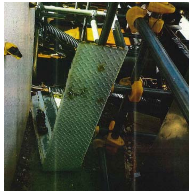
落下した点検用の足場