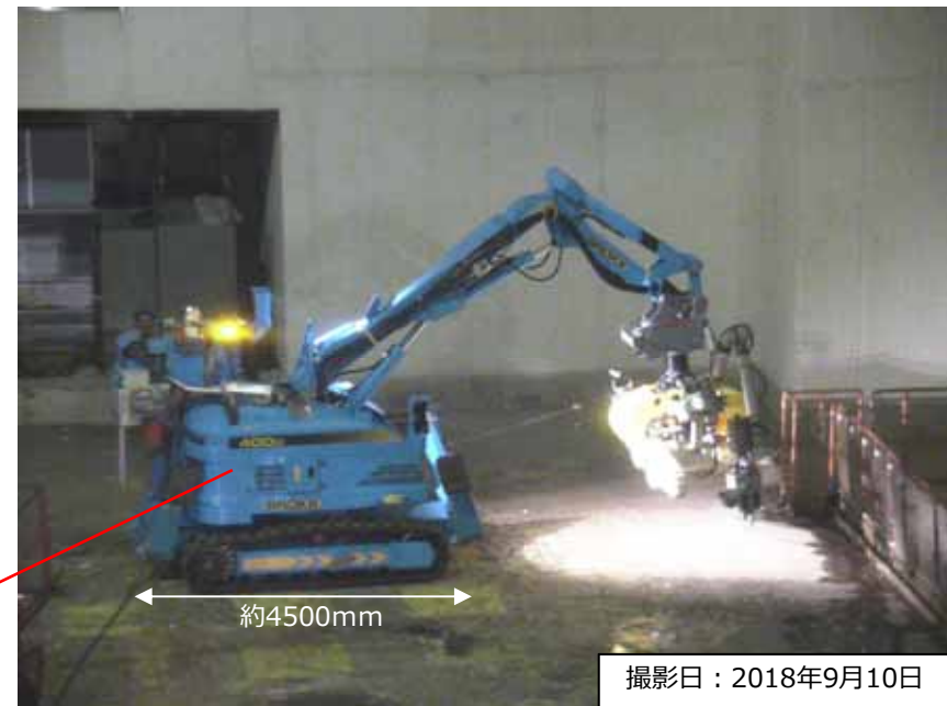
<BROKK400DでWarriorを移動させる様子>

<移動後のWarriorの様子> 今後の作業に干渉しないよう 現在はオペフロ内南西側に 仮置きしています。