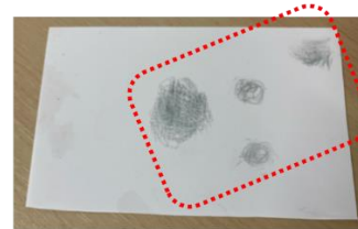
ORPセンサ表面から除去された汚れ