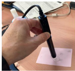
研磨フィルムで白金センサ 表面の被膜を除去