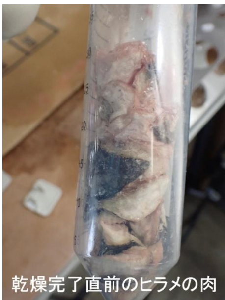
乾燥完了直前のヒラメの肉