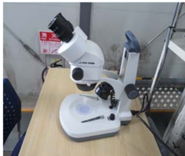
卵確認用の顕微鏡