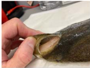
飼育訓練で寄生虫( Neoheterobothrium hirame )により貧血となったヒラメ

飼育訓練で半年ほど前に苦労した寄生虫による貧血症。飼育試験では週一回のペースで顕微鏡観察を行っています。通常海水・ALPS処理水添加水槽いずれも、これまで寄生虫の卵は確認されていません。引き続き気を抜かずに飼育と観察を続けていきます。(F)