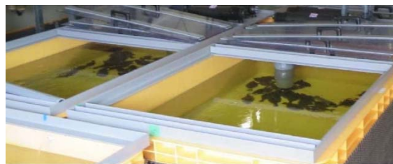
元気なヒラメたち(ALPS処理水添加水槽)