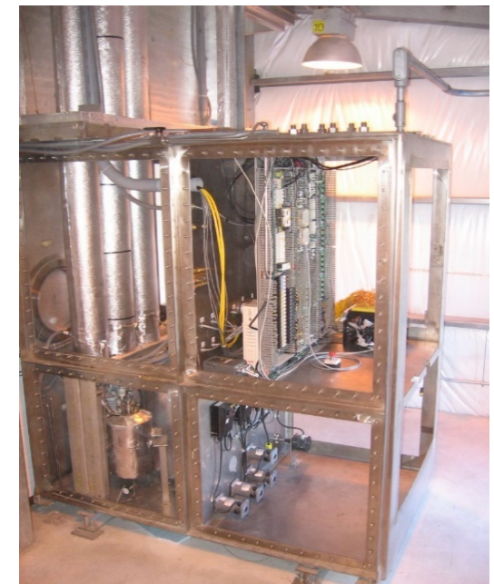
Kurionの小規模システム(大規模システムの部材は確保中)