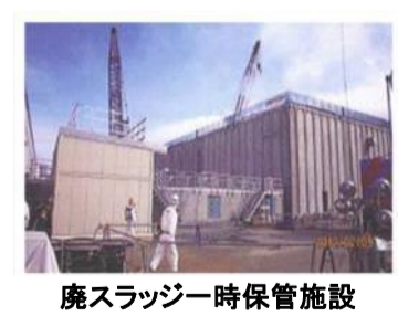
廃スラッジ一時保管施設