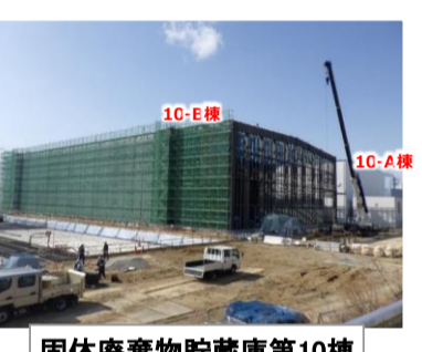
固体廃棄物貯蔵庫第10棟