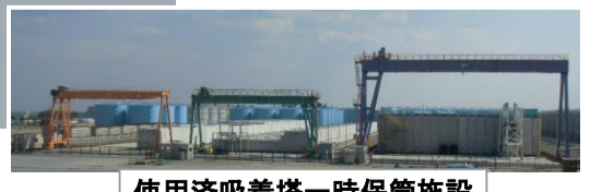
使用済吸着塔一時保管施設