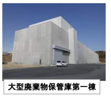
大型廃棄物保管庫第一棟