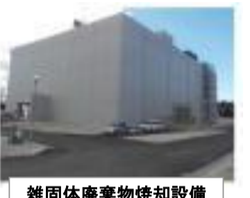
雑固体廃棄物焼却設備