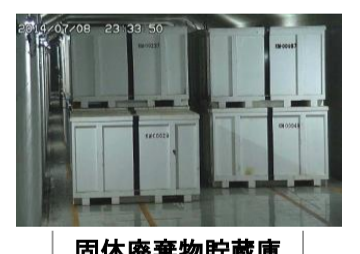
固体廃棄物貯蔵庫