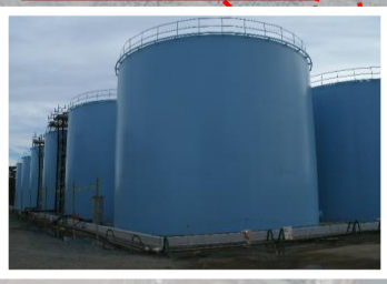
タンクの設置状況