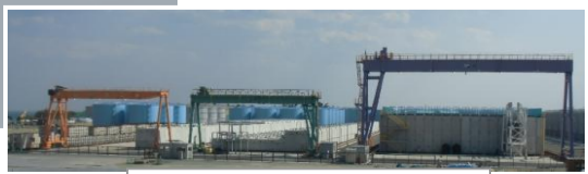
使用済吸着塔一時保管施設