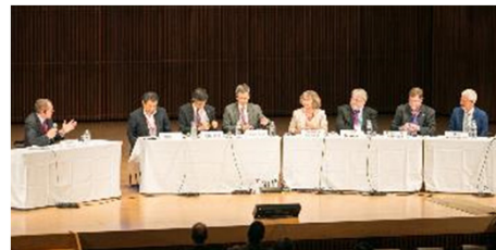
パネルディスカッション