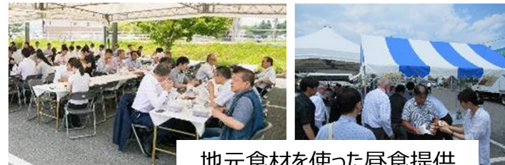
地元食材を使った昼食提供