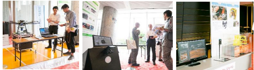
技術ポスター、ロボット展示