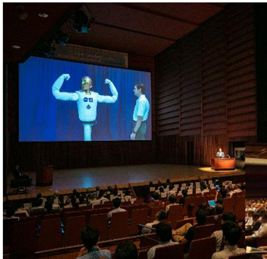
メインセッション（プレゼンテーション）