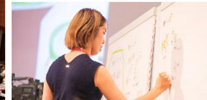
グラフィックレコーディング