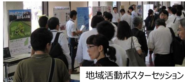
地域活動ポスターセッション