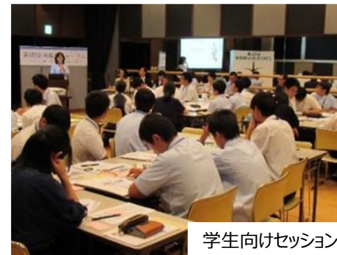
学生向けセッション