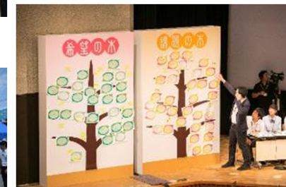
希望の木、課題の木