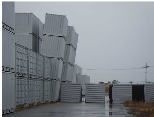
2月13日地震時の転倒状況（20ftコンテナ）