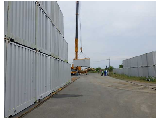
積み直し作業実施状況