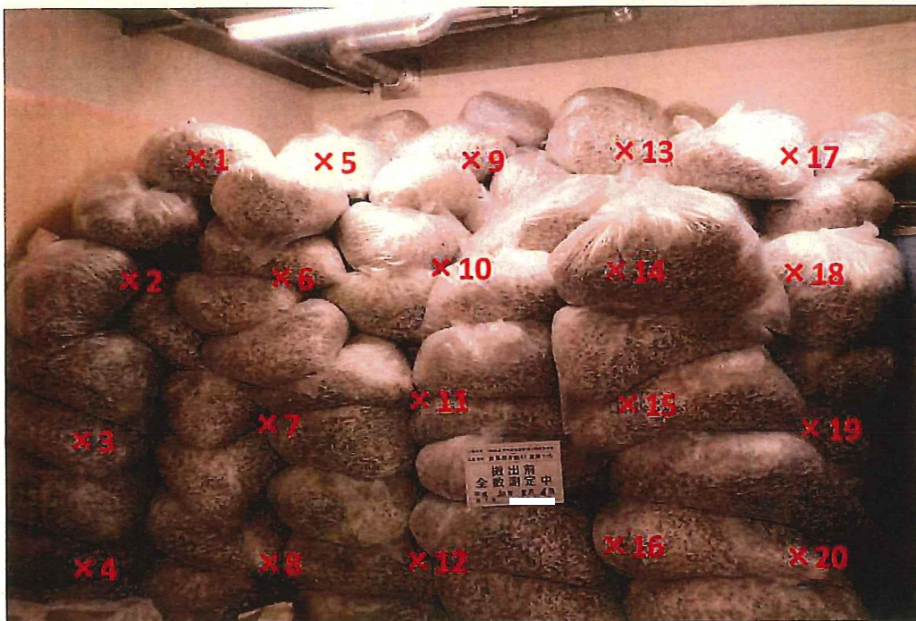
シュレツダー屑 表面線量率測定結果 ( \mu\text{Sv/h} )

測定器: F1-SC-137 時定数: 10 sec B G : 0.07 \mu\text{Sv/h}