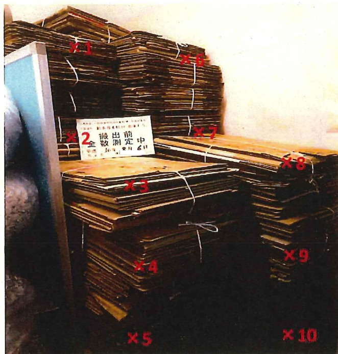
段ボール 表面線量率測定結果 ( \mu\text{Sv/h} )

測定器: F1-SC-137 測定数: 10 sec BG: 0.07 \mu\text{Sv/h}