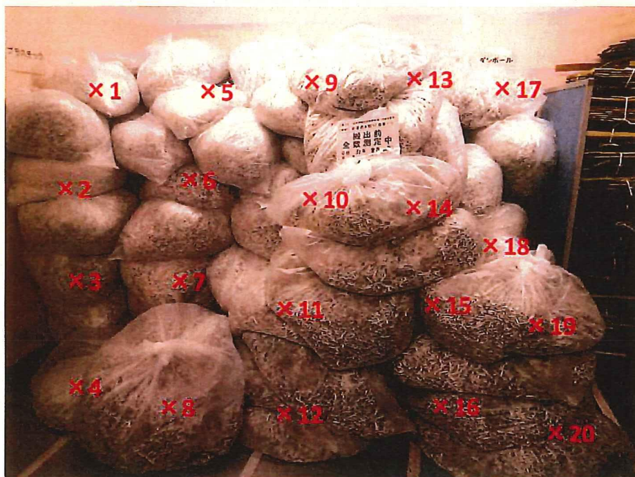
シュレッダー屑 表面線量率測定結果 ( \mu\text{Sv/h} )

測定器: F1-SC-139 時定数: 10 sec B G : 0.07 \mu\text{Sv/h}