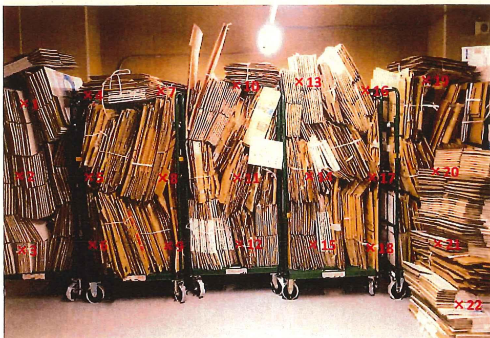
段ボール 表面線量率測定結果 ( \mu\text{Sv/h} )

測定器: F1-SC-137 時定数: 10 sec B G : 0.07 \mu\text{Sv/h}