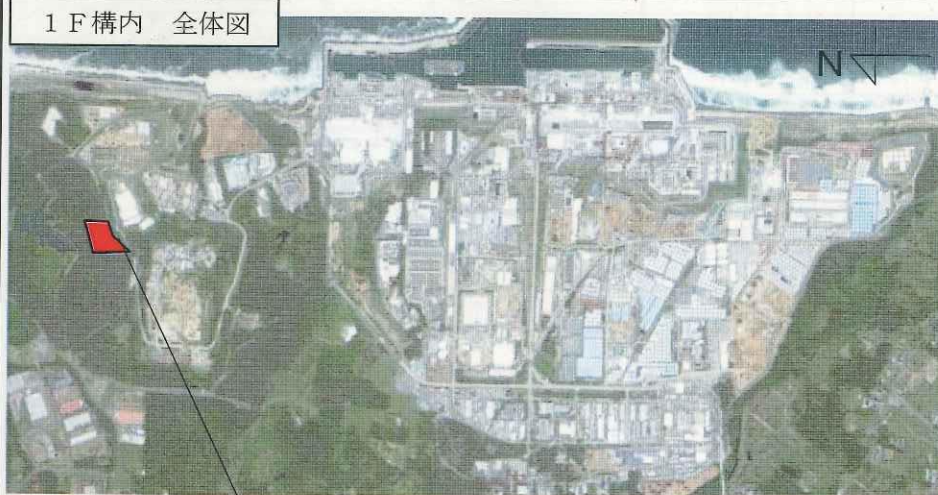
1 F 構内 全体図