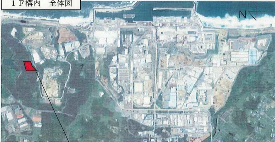
1 F 構内 全体図