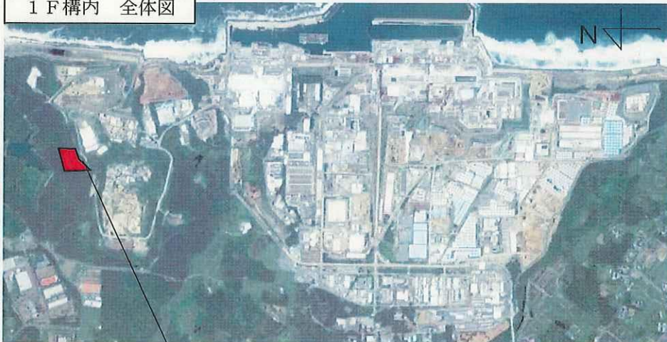
1 F 構内 全体図