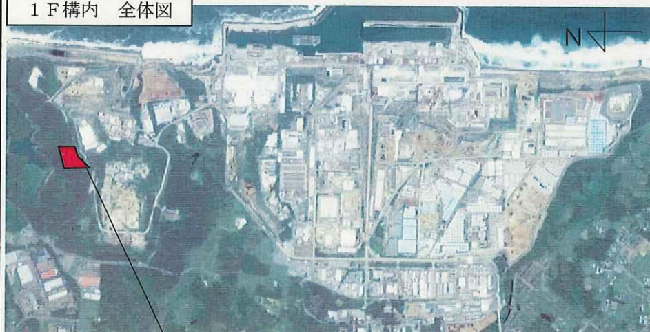
1 F 構内 全体図