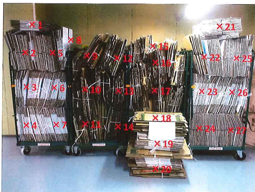
段ボール 表面線量率測定結果 ( \mu\text{Sv/h} )

測定器: F1-SC-075 時定数: 10 sec B G : 0.07 \mu\text{Sv/h}