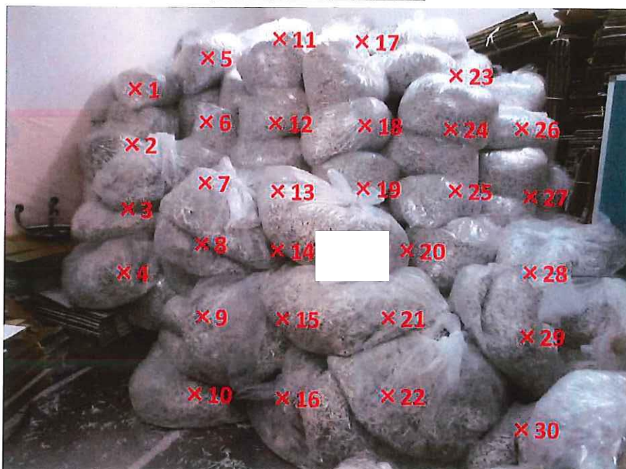
シュレツダー屑 表面線量率測定結果 ( \mu\text{Sv/h} )

測定器: F1-SC-075 時定数: 10 sec B G : 0.07 \mu\text{Sv/h}