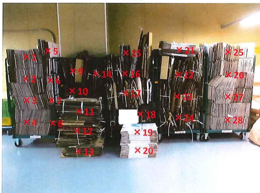
段ボール 表面線量率測定結果 ( \mu\text{Sv/h} )

測定器: F1-SC-075 時定数: 10 sec B G : 0.07 \mu\text{Sv/h}