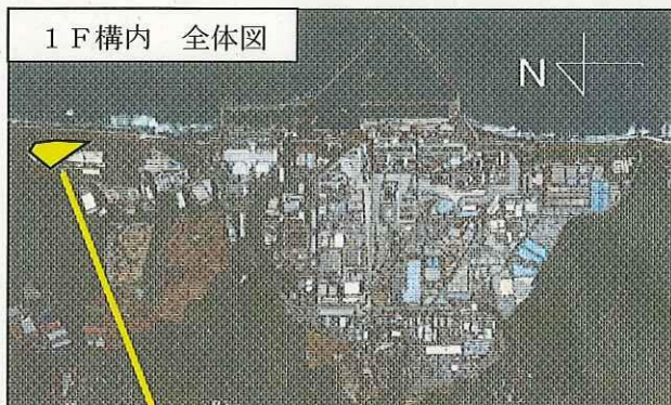
1 F構内 全体図