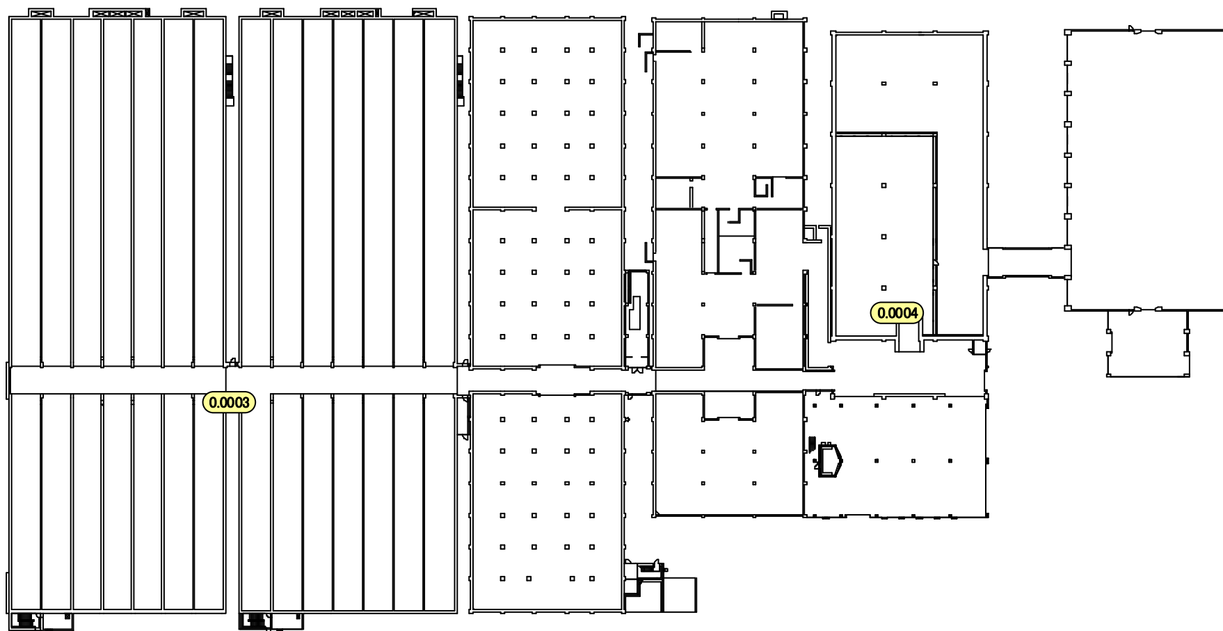
固体廃棄物貯蔵庫 第3棟