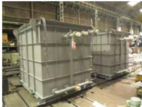
海水循環浄化装置