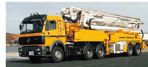
コンクリートポンプ車