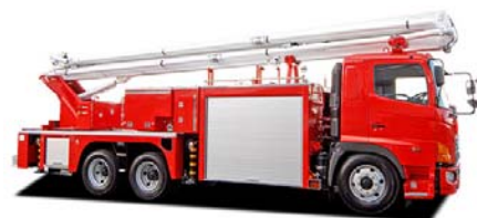
屈折放水塔車