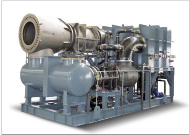
写真2 軸流式水冷媒冷凍機（直接熱交換器タイプ）