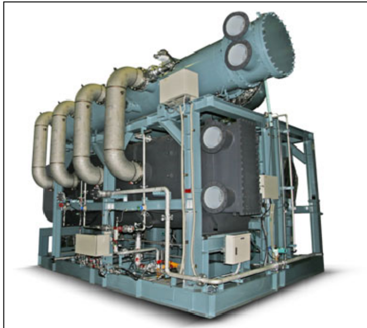
写真1 軸流式水冷媒冷凍機（間接熱交換器タイプ）