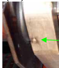
ブラシホルダー支えの短絡痕