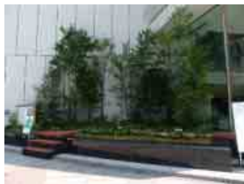
※写真は昨年度の様子