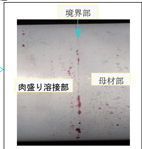
(液体浸透探傷検査時の指示模様写真)