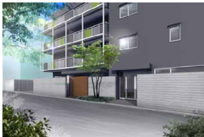
< 完成予想CG >