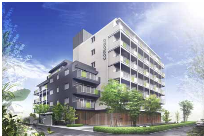
< 完成予想CG >