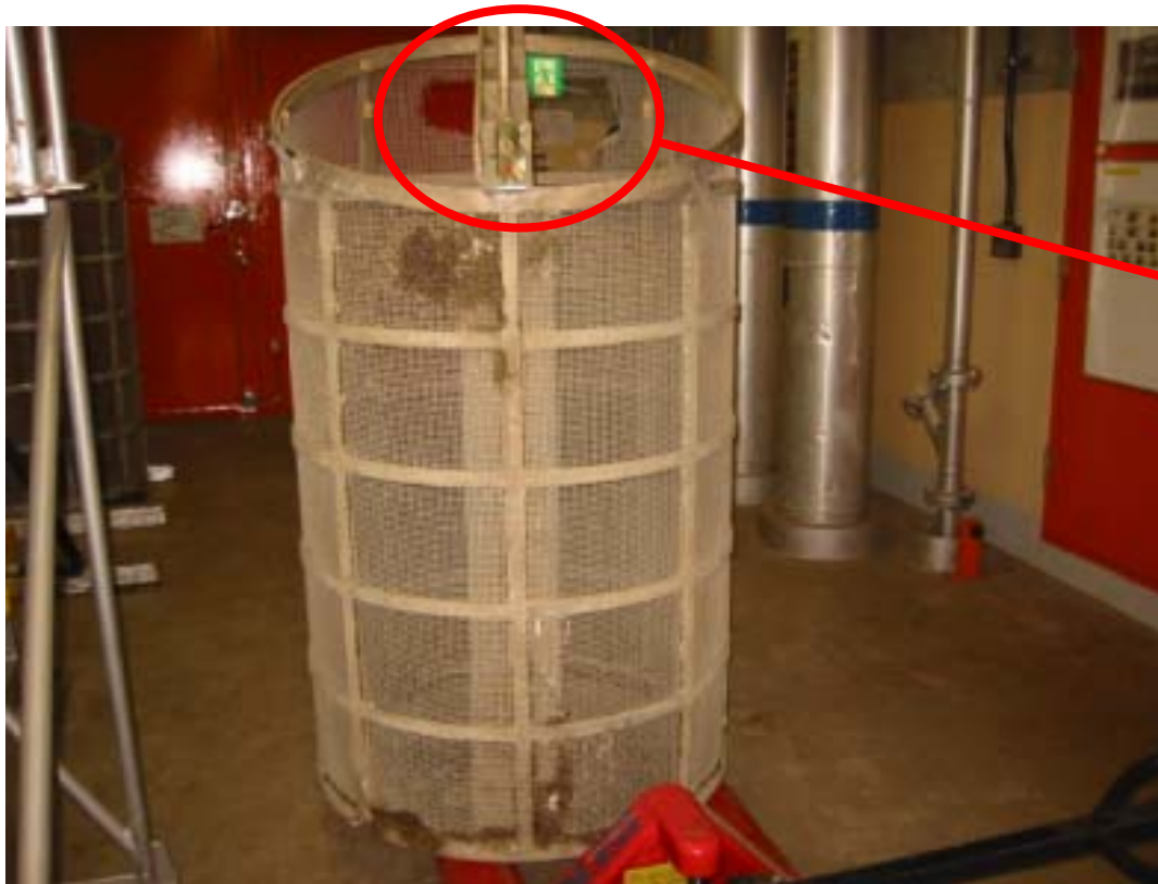
残留熱除去機器冷却系海水ストレーナ(B) 金網の全体外観