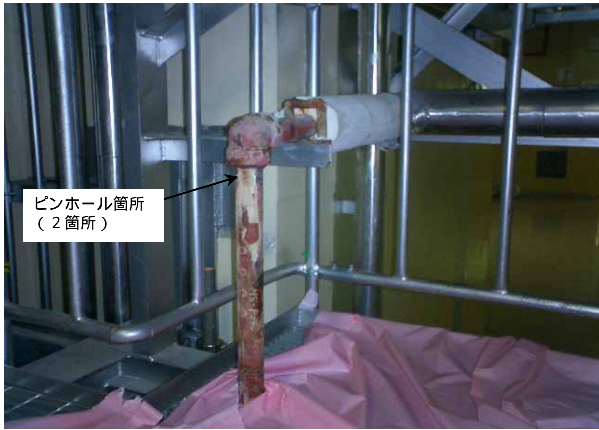
K-1 主蒸気リード管ドレン配管状況概略図