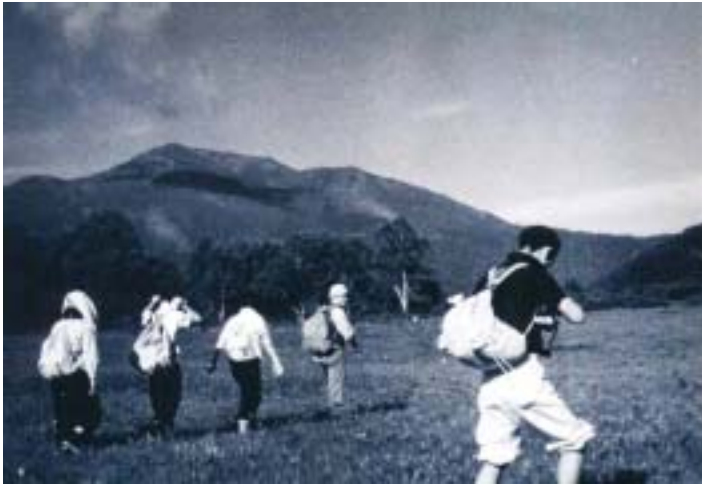
昔 湿原の中を歩く・・・昭和27年頃