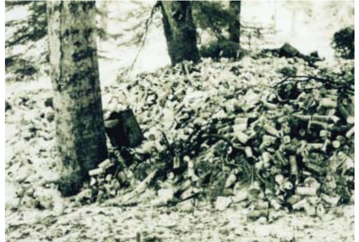
昔 ゴミの山・・・昭和49年頃