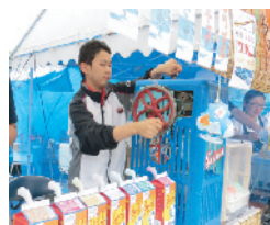
来さまいフェスタ2015