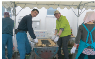
小田野沢海の日祭典