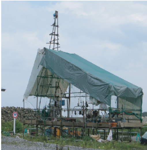
ボーリング調査用の櫓と作業の様子

東通原子力発電所の安全対策施設設置を検討するため、今年から建設用地内の地質データをより詳しく調べる追加の地質調査を実施しています。