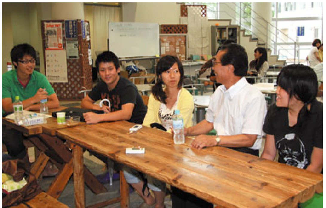
なごやかに学生たちと談笑