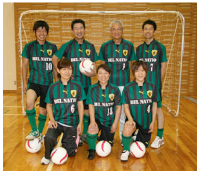
取材当日に集合した「BEL NATIO」メンバーの皆さん