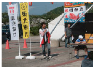
PSPをゲットしようゲーム大会

今後とも、地域イベントに参加しイベントを盛り上げていくとともに、地域の方との交流を図っていきます。