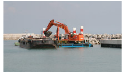
港内しゅんせつ工事状況