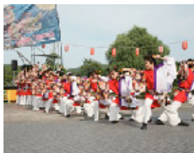
迫力溢れるステージ演舞