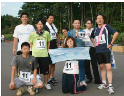
構内駅伝大会への参加