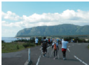
素晴らしい景観尻屋崎