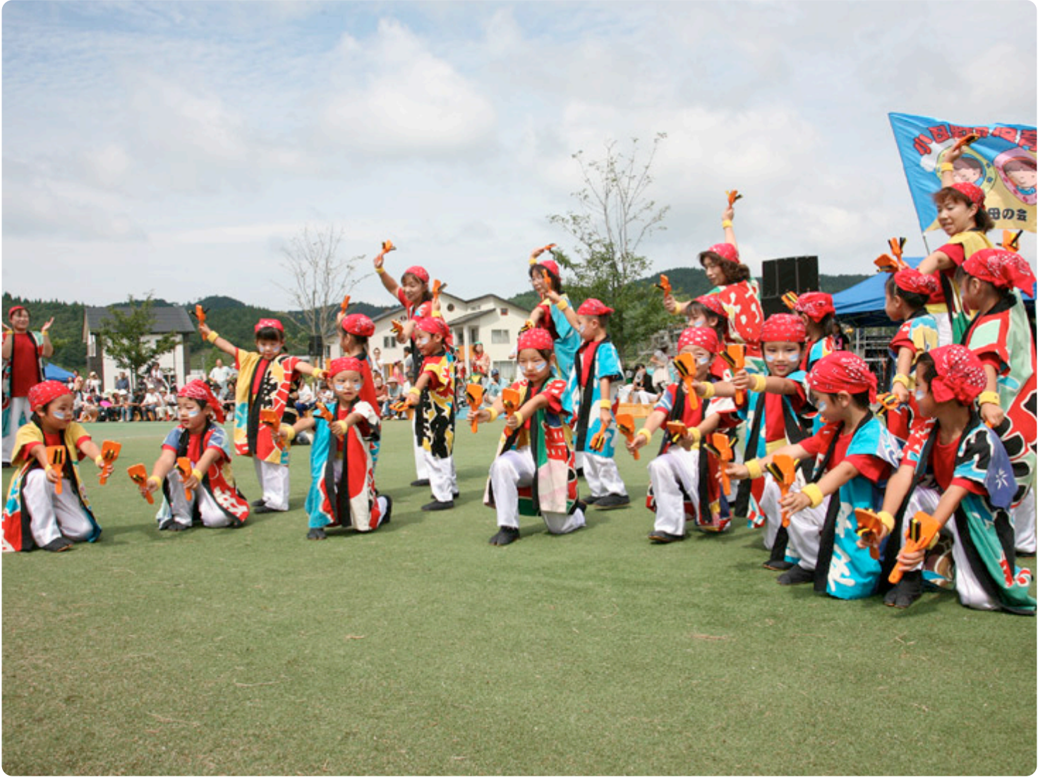
「よさこい下北(ひがしどおり来さまいフェスタ2010)」の様子