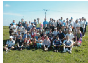
気持ちも心も晴れやか記念写真!