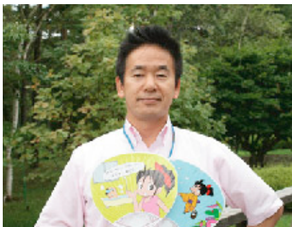
大杉グループマネージャー