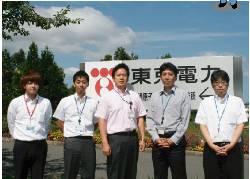
私たち、経理資材グループメンバーです

本格的な建設工事の着工を控え、当事務所のスローガンである「私たちは地域と共に 安全最優先を合言葉に 世界に誇れる原子力発電所を建設します」という私たちの誓いを常に意識して、真摯な姿勢で仕事を進めていきたいと思っておりますので、今後ともよろしくお願いたします。