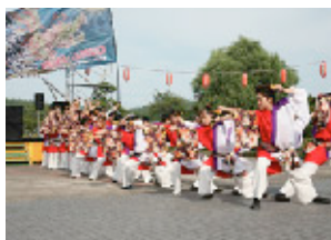
迫力溢れるステージ演舞