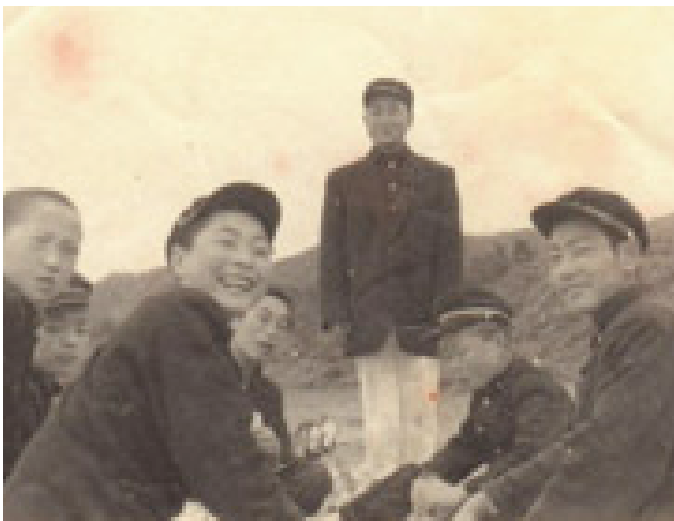
中学1年生の頃、クラスメイトと(左から三人目)