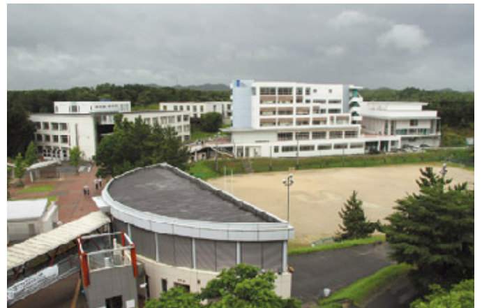
12,000人が学ぶ日本福祉大学美浜キャンパス

アクティブでエネルギッシュ。少年のような瞳が、とても眩 まぶ しく感じられました。