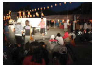
あの日の思い出がよみがえるイントロクイズ