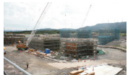
冷却水路屋外諸基礎工事状況