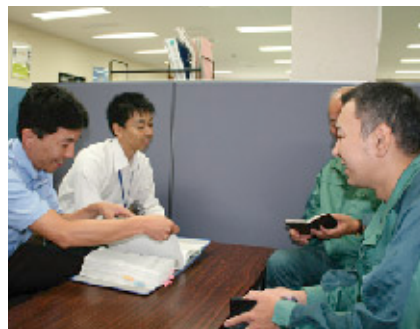
協力企業との打合せ