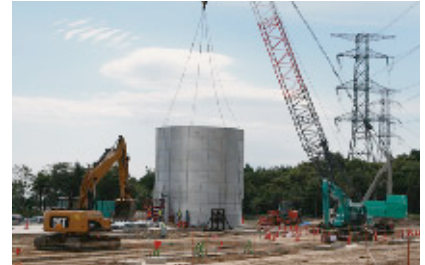
コンクリート製造設備建設状況