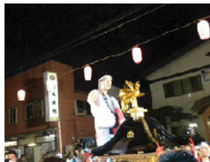
お祭りにも積極的に参加