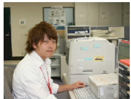
出納業務を行うメンバー