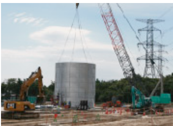
コンクリート製造設備建設状況