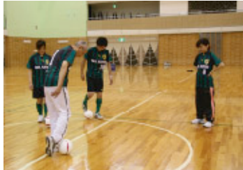
蹴り方から地道に基礎練習