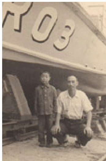
小学1年生の頃、海上保安部救助艇前でお父さんと