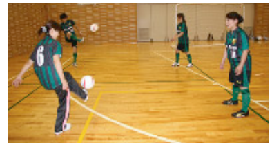
的確に味方へパスする練習