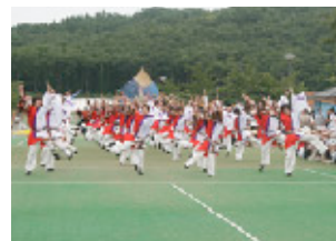
息ピッタリの流し踊り