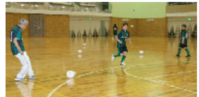
走り込んでいざシュートへ!!