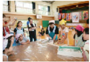
上手に切れるかな

昼食は、自分たちが切ったそばを茹でてもらい、ざるそばにして試食。東通米で作ったおにぎりも一緒に食べ、