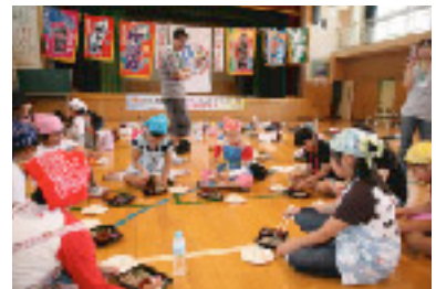
自分たちで切ったそばで昼食

東通★東風塾メンバーは「交流事業の重要性を再認識しました。これからも電源地域と消費地交流を継続していきます」と決意を語っていました。