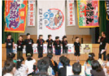
東通村を紹介するわらしたち

「東通★東風塾」と「東通村商工会」が主催し7年目を迎えた今年は、初年度に交流した入口地区から「わらし(子ども)」8人と