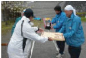
強豪揃いの中、優勝!!