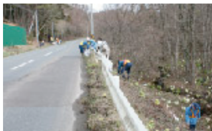
グループに分けて清掃活動