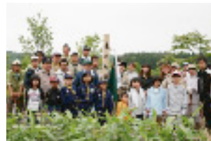
植樹後の記念の一コマ