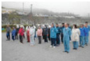
みんな強者揃いです!

今後とも、地域の一員として、地域の行事に参加しながら地域の方々との交流を図っていきます。