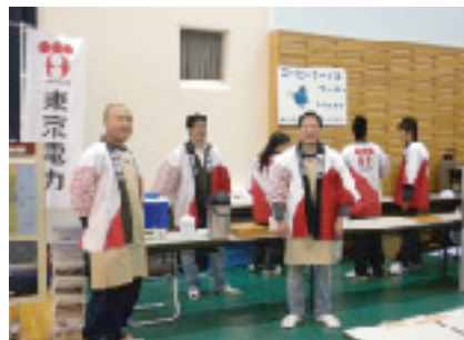
東通村産業まつりに参加