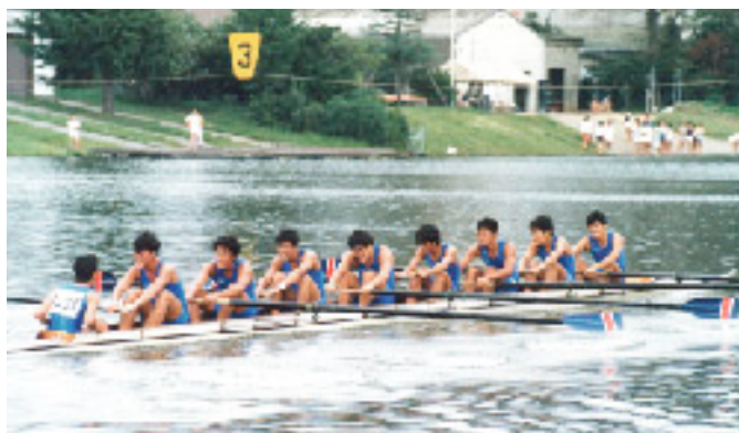
東レボート部の選手時代

卒業後は専門学校に進む予定が、先輩の推薦で東レへ入社。その年、東レ滋賀ボート部は日本一に輝き「みんな手足も長く、カッコ良かった」と印象を話します。東レの場合、8人で漕ぐエイトがレギュラー。若手や準レギュラーは4人漕ぎと2人漕ぎ。レギュラー争いは熾烈 しりつ で、ようやくレギュラーの座を射止めたとき、チームの成績は一番底。結婚して生まれた子どもが病弱だったこともあり、22歳の若さで引退を決めたのです。