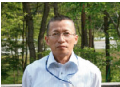
水戸グループマネージャー

私たちは、原子力発電所を受け入れていただいた地域の皆さまへの感謝の気持ちを忘れずに人と人との繋がりや結びつきを大切に、東通原子力発電所と、ここで働く職員が地域の一員として、地域に溶け込み、地域と共に歩んでいけるよう、ハートトゥハートで業務を行ってまいりますので、これからもどうぞよろしくお願いいたします。