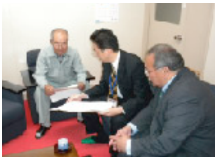
地域事務所を訪問