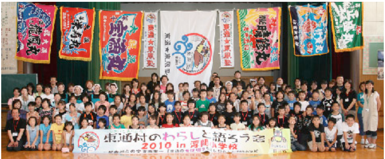
みんな笑顔で東通大好き！