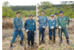
当所と協力企業の参加者