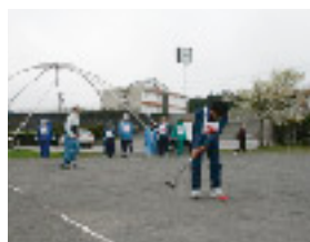
ゲート通過するか緊張の瞬間