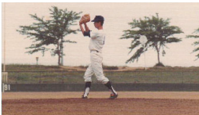
エースで4番だった頃の中学生時代

「中学時代は野球部だったんですよ。ピッチャーで4番。高校に入ってすぐに野球道具一式を買い、硬式野球部の練習を見に行こうとした時、先輩に呼び止められ田名部川に連れてかれたのがきっかけです」