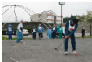
ゲート通過なるか緊張の瞬間