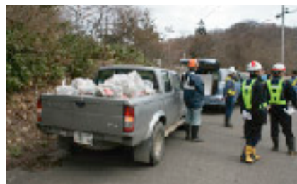
一つのグループで拾ったゴミの量