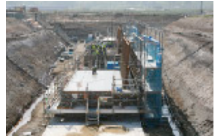
本館建屋周辺整備工事状況