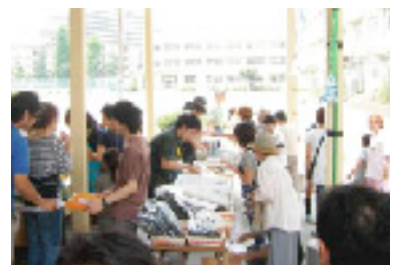
ミニ物産展オープン

なお、7月23日から7月25日には、浮間小学校の子ども達が来村し、ホームステイを通じて交流を深める予定です。