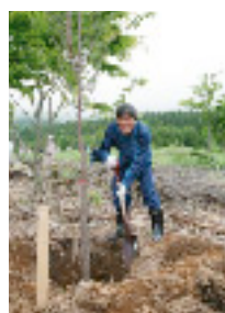
オオヤマザクラを植樹する四方所長