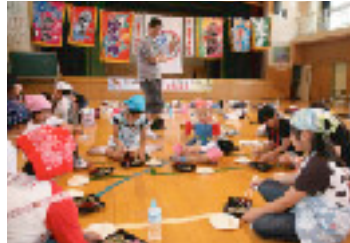
自分たちで切ったそばで昼食