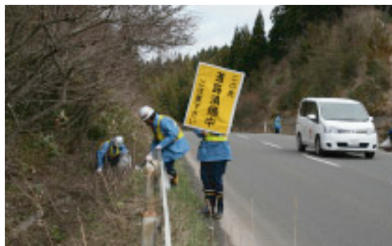
安全を配慮しながら実施

4月21日、当所所員および協力企業の方約70名が参加し、国道338号の清掃活動を実施しました。