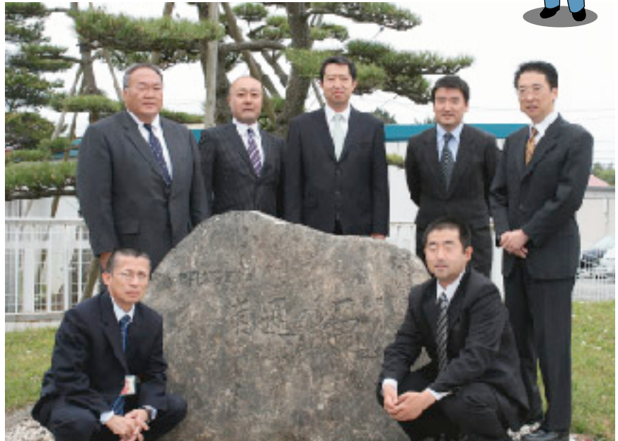
私たち、立地地域グループメンバーです!?

私たち立地地域グループは、建設を進めている東通原子力発電所と地域の皆さまとの結びつきをより強くするとともに、地域の皆さまから安心・信頼いただける原子力発電所を目指し、日々活動しているグループです。メンバーは水戸グループマネージャーをはじめ7名で構成されています。