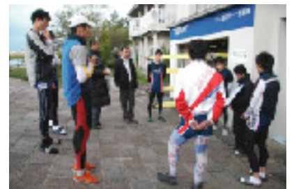
ミーティング風景