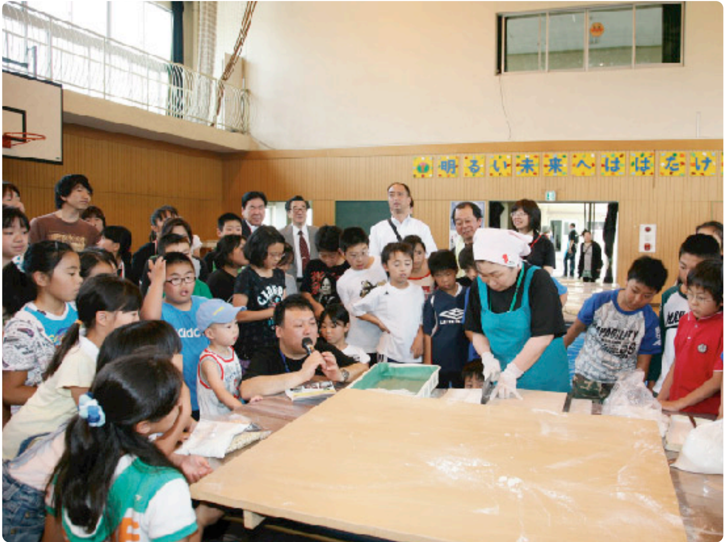
「東通村のわらしと語ろう会2010in浮間小学校」の様子