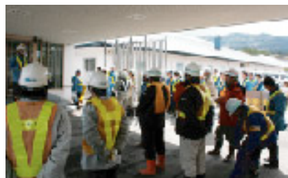
開始前に注意事項を説明

今後とも、地域の一員として、東通村の美しい自然を守っていくための取り組みを継続していきたいと思えます。