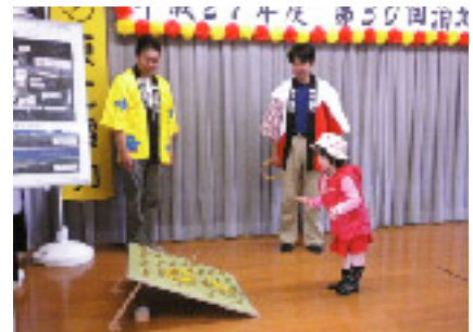
泊地区公民館祭に参加