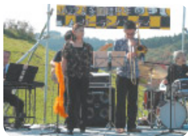
ガーデンパーティの様子

最初に行ったのは昨年7月、ひとみの里公園での「大バーベキュー大会」でした。まずは仲間を増やし、交流しようと、東通牛のバーベキューを囲んでワイワイ!