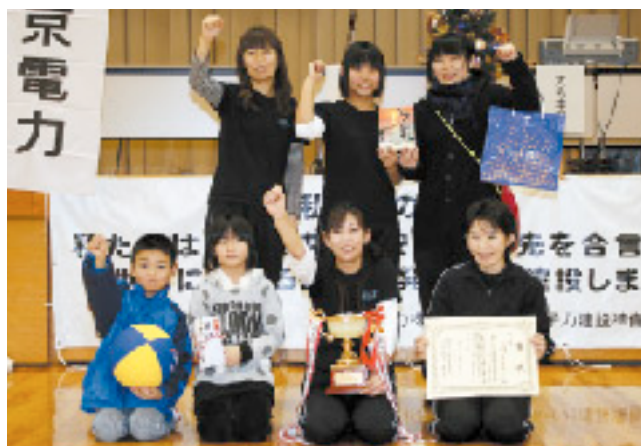
祝優勝!『IZBホタテガールズ』チームの皆さま

今大会には、村内各地域の女性から構成される15チーム、約90名もの方々の参加をいただき、各試合とも熱戦が繰り広げられました。