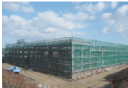
水処理建屋建設工事状況