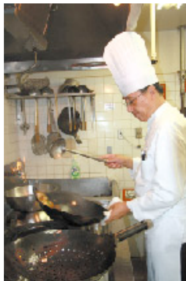
見事な鍋さばきを披露

高校卒業後は東京の調理師学校で学び、ホテルオークラ(半年)を経て、ホテルニューオータニへ。フライパンを持つまで10年修行しました。「最初にスープを作らせて貰えんですが、やっぱり田舎の味。濃いん