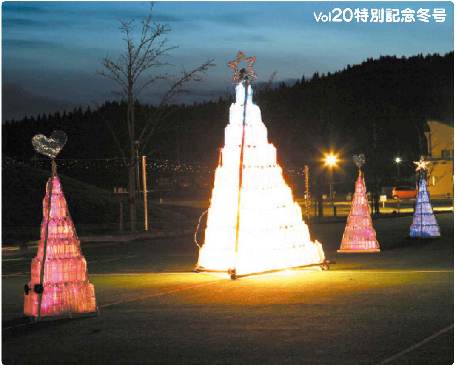
Week Around Hが制作したペットボトルECOツリー