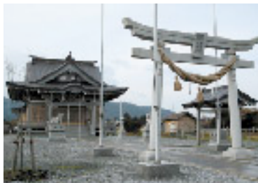
老朽化により平成14年に新築した鍵懸神社