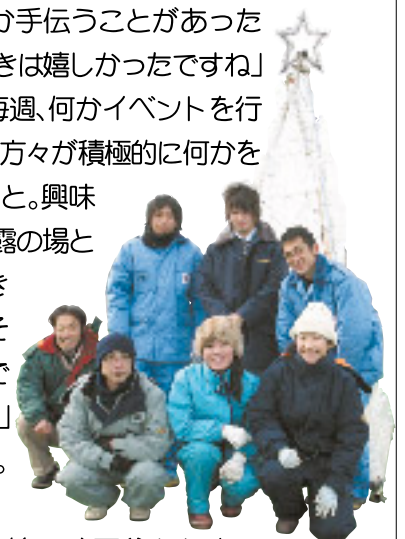
Week Around Hプロジェクトチームの皆さん

これからの目標は、毎週、何かイベントを行うこと。「理想は、住民の方々が積極的に何かをやってみたいと思うこと。興味のあることや趣味の披露の場としてイベントを企画できればいいと思います。それに対して我々が協力できることを望んでいます」と呼びかけていました。