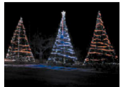
事務所前にあるイルミネーション

東京電力の原子力発電所を立地している「電気のふるさと」である地域の方々に、感謝を込めて、楽しみながら、電気の暖かさ・明るさを実感していただければと思っています。また、この地域が原子力発電所の建設によって、世界の地球温暖化防止に貢献していることをお伝えできればと思います。