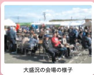
大盛況の会場の様子