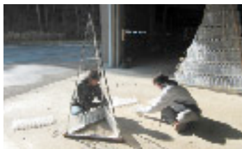
制作中のペットボトルecoツリー