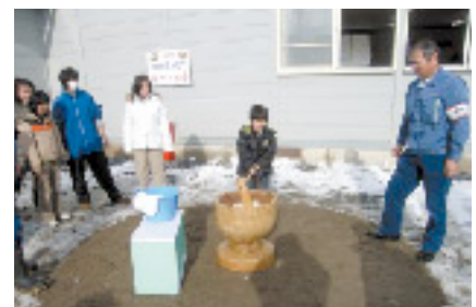
近隣住民の方々とのふれあい餅つき

●敷地造成工事JVの業務内容など、お分かりいただけましたか。次回は、「水処理建屋JV」をご紹介します。