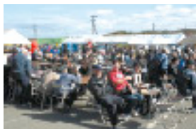
第41回東通村産業まつりの様子