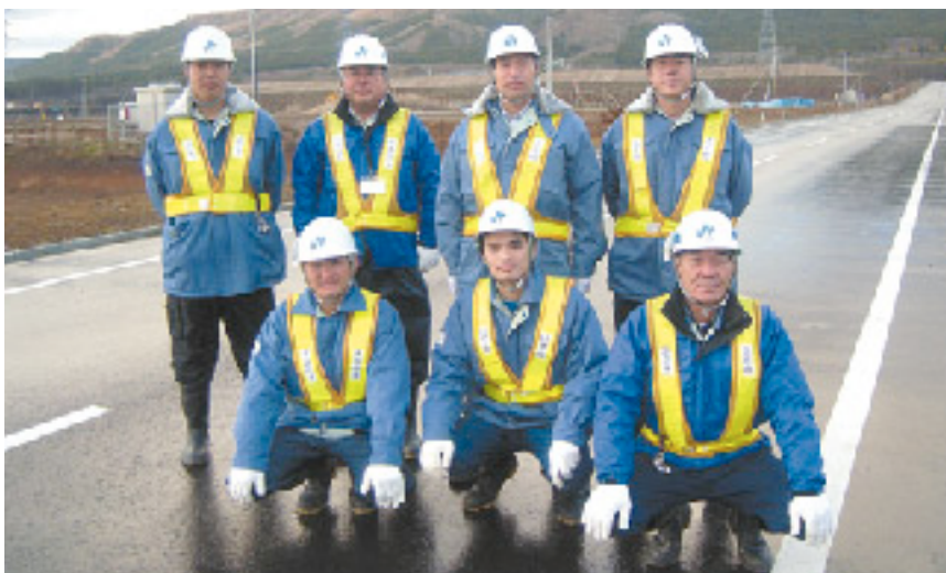
JV職員で「ハイ・ポーズ」

敷地造成工事JVとしては、来年夏で終了予定となっていますが、最後まで、安全を最優先に事故の無いよう工事を進めていきたいと思っています。