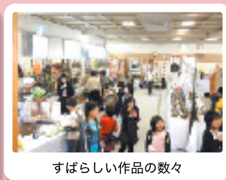
すばらしい作品の数々