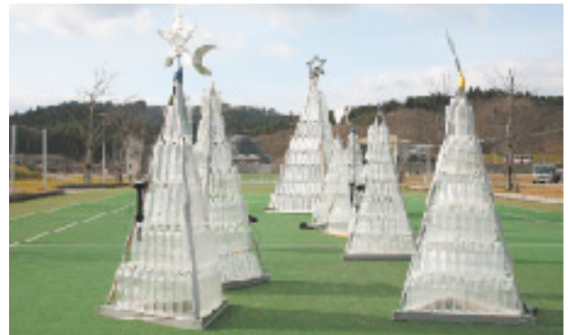
Week Around Hが制作したペットボトルecoツリー

高さ3mの手造りペットボトルecoツリーは、4,800個の電球で闇夜を照らし、ビーフシチューやシフォンケーキを振る舞って点灯式は大賑わい。