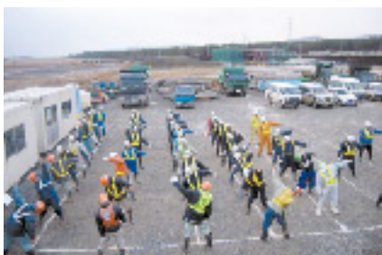
ラジオ体操は1日のスタート