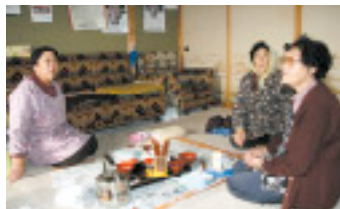
墓地待休所での老婆会の皆さん

また、青年会は神社のしめ縄を取り替えたり、子ども会はねぶた運行やゴミ拾い、老人クラブは墓地や神社の草取り。老婆会は地蔵様を守り寒念仏を行うほか、墓地待休所では毎日楽しく仲良く過ごすなど、世代間での「絆」を感じます。