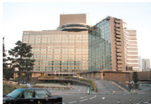
ホテルニューオータニの全景

「私が高校生の頃はスクールバスがなく、田名部高校の近くに東通村が独自の寮を設けてくれていました。1年生は、寮のおばさんが作ってくれたおかずを、全員分、毎朝お弁当に詰めなければならぬ。大変だけど楽し