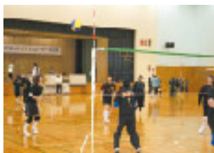
会場は選手の熱気につつまれて