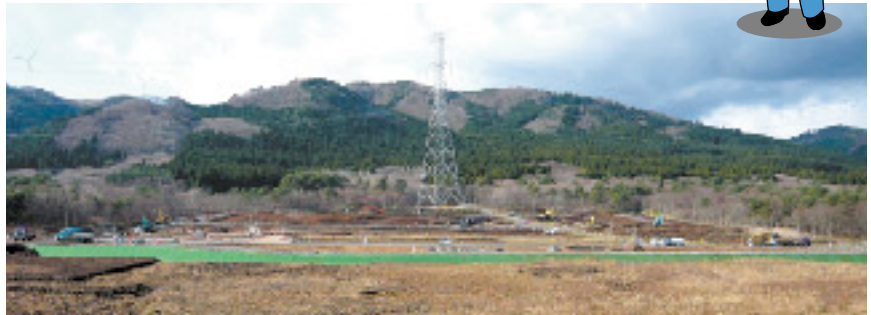
コンクリート製造施設造成工事の様子