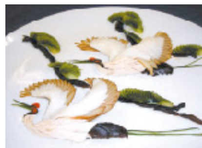
鮮やかな野菜細工

将来は後輩の指導に力を注ぐ意向で「故郷の食材で美味しい上海料理を作りたいし、いつかは東通で中国料理の教室も開きたい。今度帰省したときは、ゆっくりと東通の郷土料理を味わいながら、能舞を鑑賞したいですねえ」。優しい笑顔が、きらめいていました。