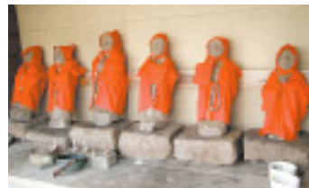
老婆会が世話をする地藏様