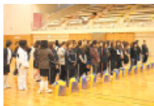
15チーム 約90名が参加