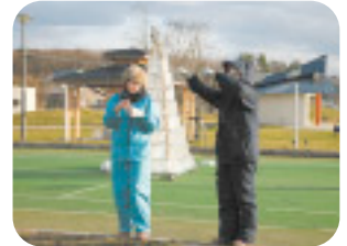
イルミネーション取付作業

「企画の検討では、村に住む若者たちからいっぱい良い意見が出され、どれにするか迷ったくらいです。自分たちがおもしろそうだと思ったことを、村の後押しで取り組むことができて本当に良かった。たくさんの年長者からのアドバイスは参考になったし、会員以外の人にも『何か手伝うことがあったら言って』といわれたときは嬉しかったですね」