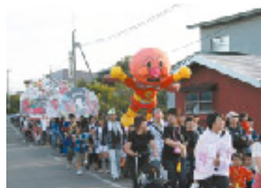
小田野沢子ども会のねぶた運行

神楽会のほか、小田野沢では婦人会により1月15日、16日は「もちつき踊り」が行われます。神楽会が行う正月の門打ちに対し、これは小正月の伝統行事で、着物にタスキ姿の女性たちが、全戸をまわって豊作を祈願します。