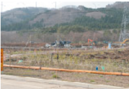
コンクリート製造施設の造成工事状況