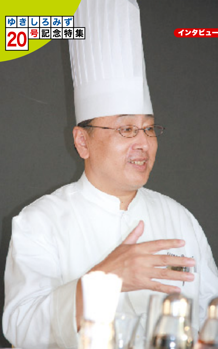
(東京)ホテルニューオータニ F&Bデビジョン 中国宴会料理長