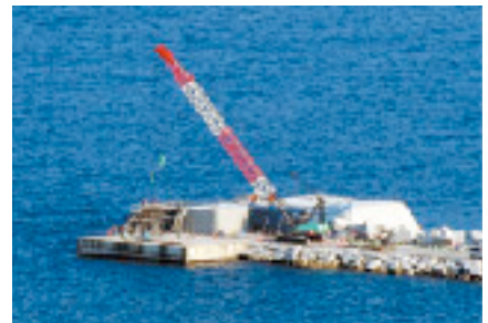
防波堤上部の構築物設置作業状況