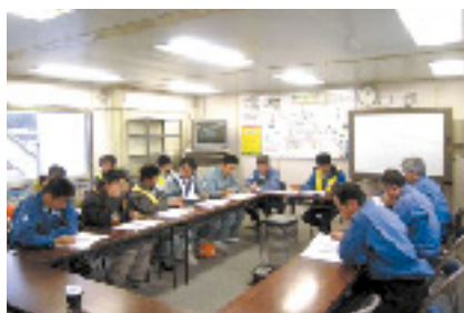
打合せは真剣です