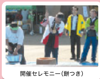
開催セレモニー(餅つき)

当社は東北電力と共同で体育館内において「喫茶コーナー」を出店し、買い物や食事の後のつかの間の休憩場所として「コーヒー」を提供させていただきました。