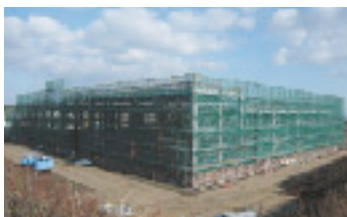
水処理建屋建設工事状況