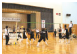
強烈なアタックが炸裂