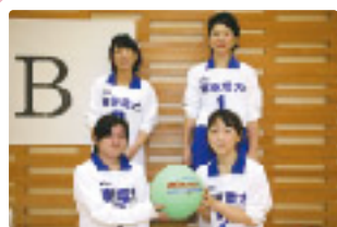
「Team TEPCO 東通」のメンバー

当社からは、『Team TEPCO 東通』が参加し、健闘も空しく予選で敗退しましたが、爽快な汗のなか楽しい一日でした。