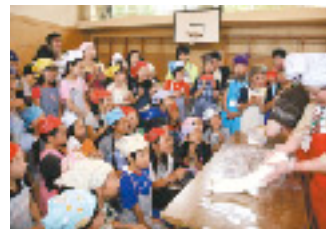
出来上がりを見て歓声と拍手が

東通★東風塾メンバーは「交流の輪が定着し、やりがいを実感している。今後も電源地域と消費地の交流を継続したい」と話していました。