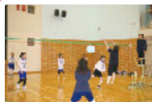
白熱した試合でした