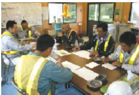
作業スケジュール等を確認する職長会議

今後は、入構ゲート周辺の駐車場整備などの工事を継続して行い、平成21年9月末には進入路工事が完了する予定です。