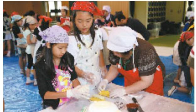
仕上りを考え真剣に作る子どもたち

そしていよいよ、子どもたちも「くるま型のべこもち」作りに挑戦です。もち米粉にお湯を注ぎ、「こねる」「色付け」「模様作り」と、手順を間違えないように注意を払い悪戦苦闘