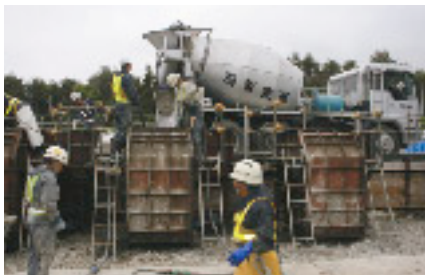
コンクリートブロック製作状況