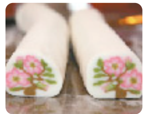
椿の花が見事です