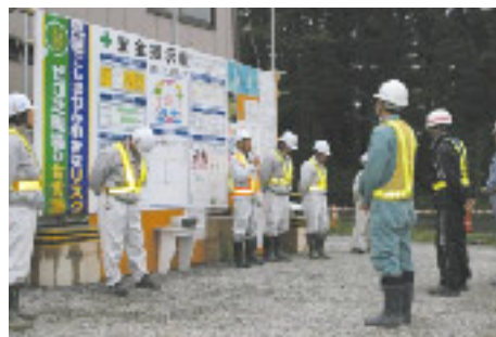
その日の工事内容等を伝達する朝礼