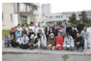
37名のウォーキング愛好者が参加しました