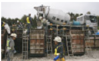
コンクリートブロック製作状況