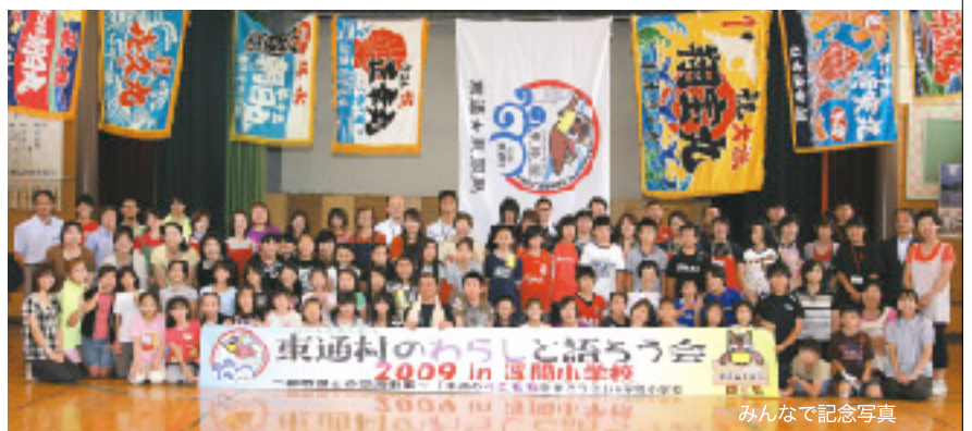
みんなで記念写真