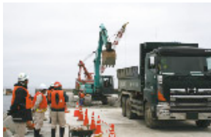
東防波堤工事状況