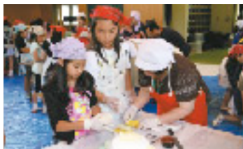
仕上りを考え真剣に作る子どもたち