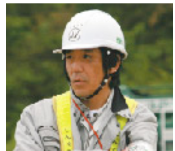
進入路工事JVの新宮所長