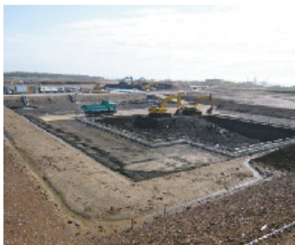
5月末の水処理建屋工事状況