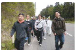
ウォーキングを楽しむ参加者