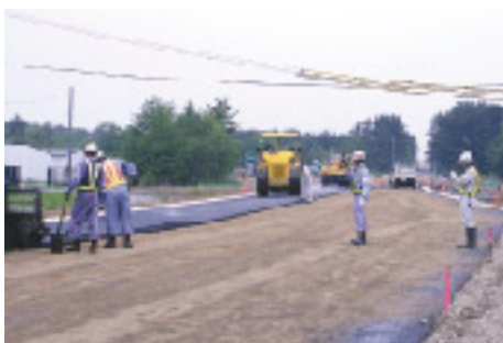
平成21年6月初旬の工事状況