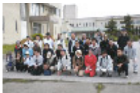
37名のウォーキング愛好者が参加しました