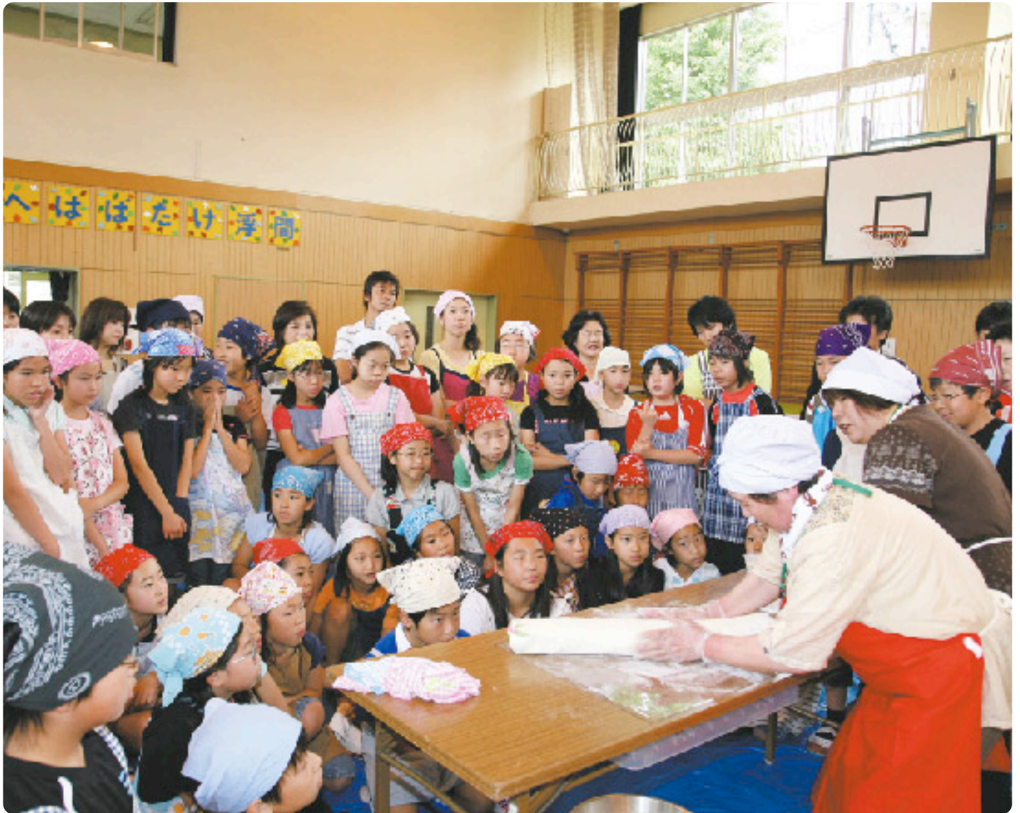
「東通村のわらしと語ろう会2009in浮間小学校」の様子