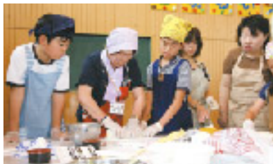
指導にも熱が入ります

13日(土)には、メインイベントである「東通村のわらしと語ろう会 2009 in 浮間小学校」が開催され、