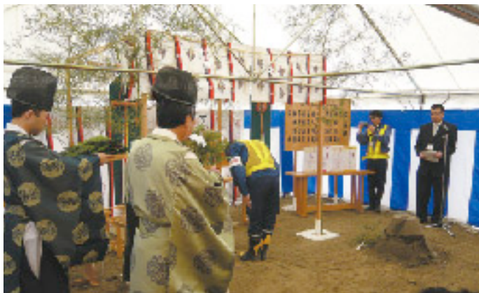
安全作業を祈願する四方所長