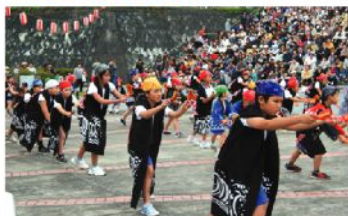
大観衆の前で「よさこい」を立派に披露