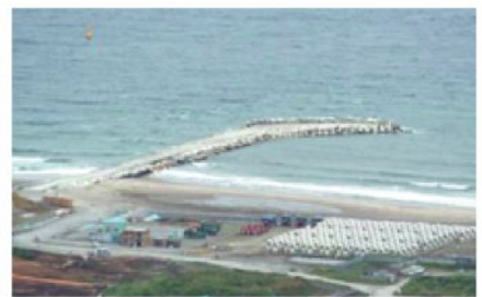
北防波堤施工状況