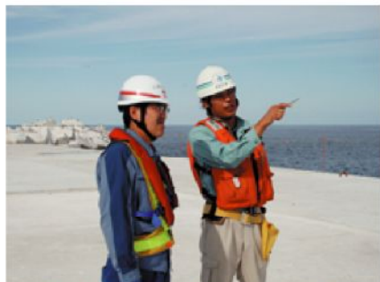
防波堤上で作業予定の打合せ(明日の波は?)