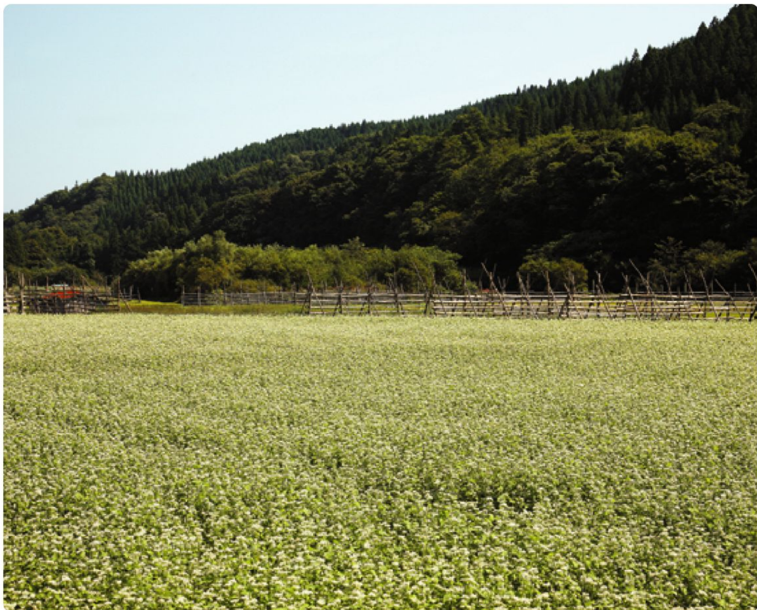
稔りの予感 そばの花