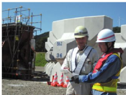
コンクリートブロック製作(足場確認よし!)