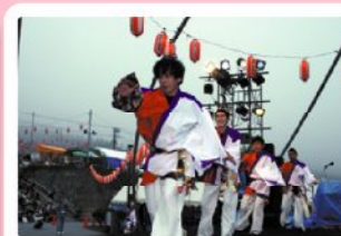
ステージでも堂々と