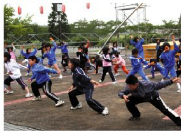
ハイ、もっと腰をおとして～

ところが最初に発表を予定していた運動会が雨のため9月に延期になり、「小田野沢キッズソーラン」の舞いは、今回が初めての舞台。祭りの前には、位置を確認するため全校