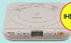
(写真はイメージです)

答えがわかった方は折込ハガキでご応募ください。正解者の中から抽選で1名様にIH調理器を、そして10名様に東通村産品詰合せをプレゼントいたします。なお、当選者の発表は発送をもってかえさせていただきます。〈応募締切/平成20年11月29日(土)当日消印有効〉クイズの答えは次号に掲載いたします。