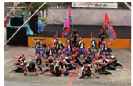
ポーズもバッチリ!!