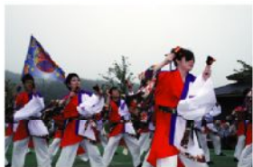
電力チーム「風舞翔吹」