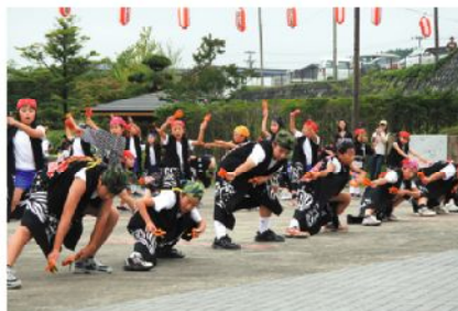
躍動感のある舞い