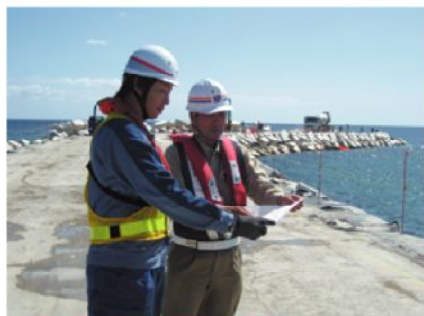
北防波堤で現場確認(計画通り延伸中)