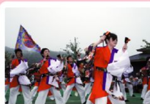
電力チーム「風舞翔吹」