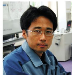
大熊グループマネージャー