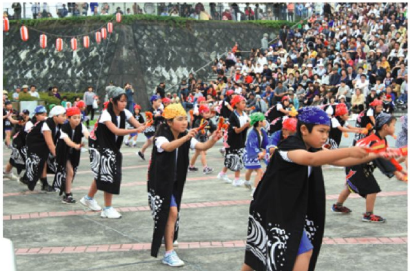
大観衆の前で「よさこい」を立派に披露

ところが最初に発表を予定していた運動会が雨のため9月に延期になり、「小田野沢キッズソーラン」の舞いは、今回が初めての舞台。祭りの前には、位置を確認するため全校