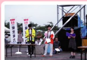
PSPゲッチュウクイズの解説