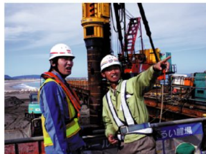
護岸工事のひとつコマ(キマってます!)