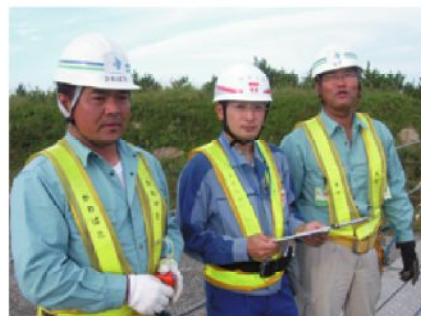
むつ小川原港でも頑張っています

●港湾土木グループの業務内容など、お分かりいただけましたか。次回は、「土木調査グループ」を紹介いたします。