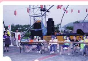
難しい問題にも挑戦