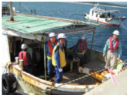
海上立会いへいざ出港(しっかり管理します)