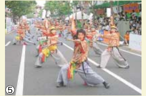
よさこい全国大会(高知) ④⑤本場高知県の晴れ舞台で堂々と演じる和心伝心