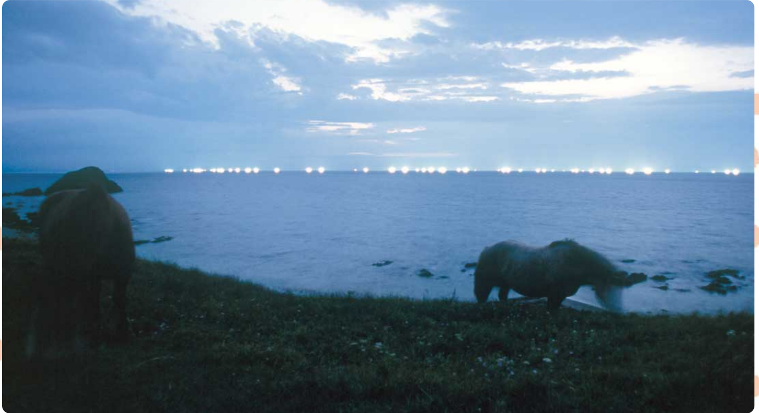
津軽海峡に浮かぶ漁火

発行/東京電力株式会社 東通事務所 〒039-4223 青森県下北郡東通村大字小田野沢字南通2-303 TEL0175-48-2121(代)・FAX0175-48-2019 ホームページアドレス http://www.tepco.co.jp/higashidori~np/index~j.html