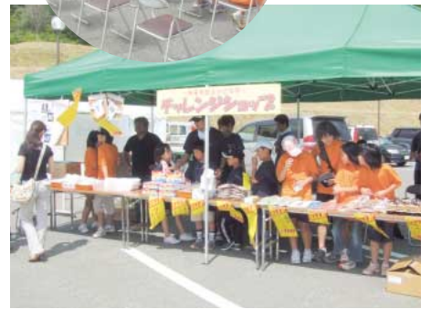
さあ開店!「いらっしゃいませ」