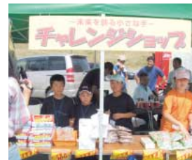
大きな声で売り込む子どもたち

販売が終わると、売り上げの集計や残った商品の返品、利益の計算なども子どもたちの手で行いました。東通小学校の児童は「物売るのは初めての経験だったけれど、頑張って声をかけ買ってもらえた時はうれしかった」とにっこり。大槻会長は「この経験を機に、参加した子どもたちの中から商売を始める人が育ち、東通村における経済発展の担い手になって欲しいですね」と熱く語っていました。