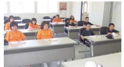
真剣に商売の「いろは」を勉強