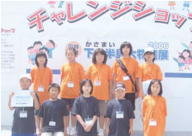
チャレンジショップに参加した子どもたち

子どもたちに商売の楽しさを知ってもらい、商業後継者の育成や新規創業の促進をはかろうと、むつ・下北地区商工会青年部連絡協議会が青森県商工会連合会の委託を受け開催しています。昨年は十和田市の道の駅