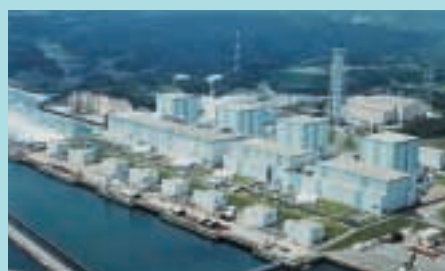
福島第二原子力発電所