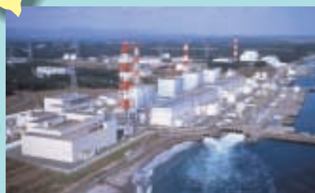
福島第一原子力発電所