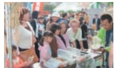
北区浮間小学校のみなさん