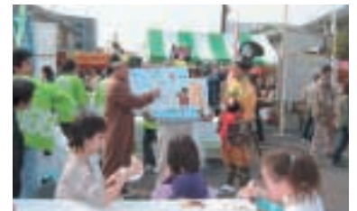
着ぐるみで紙芝居