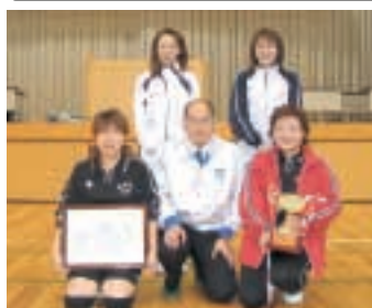
優勝の電力疾走チーム