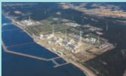
柏崎刈羽原子力発電所