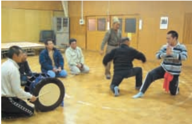
鹿橋青年会の稽古風景

能舞の“師匠どころ”として400年もの伝統を受け継ぎ、今秋、文化庁が主催し国立劇場で行われた舞台芸術フェスティバル「アジアの仮面劇 変貌する神々」に日本を代表して参加した鹿橋青年会では今月の20日から内習いが行われます。