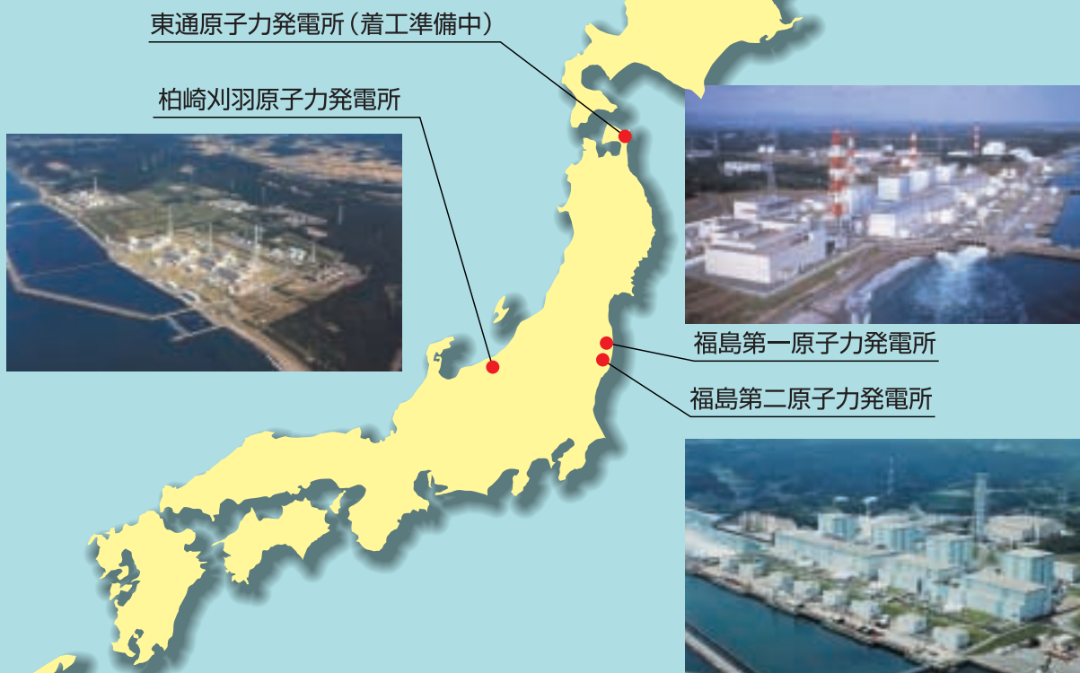
東通原子力発電所(着工準備中)