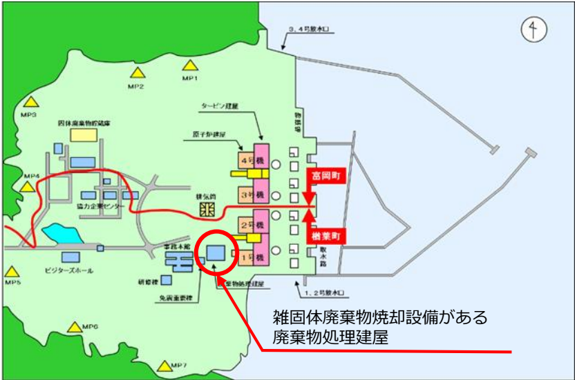
福島第二原子力発電所 現場概略図